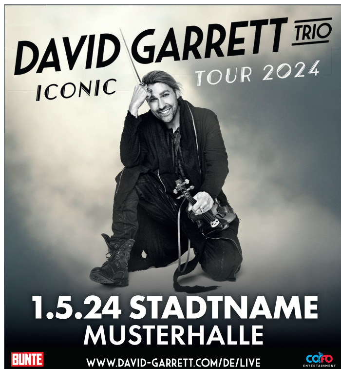
2-spaltig, 92 mm x 100 mm