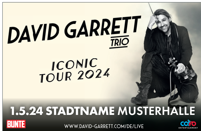
2-spaltig, 92 mm x 60 mm