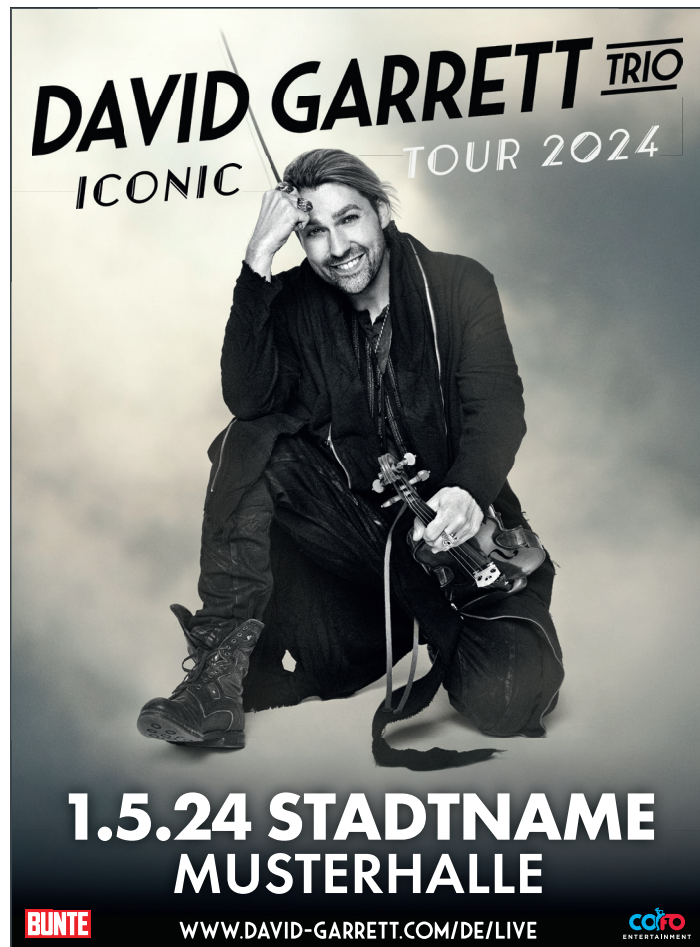
2-spaltig, 92 mm x 125 mm