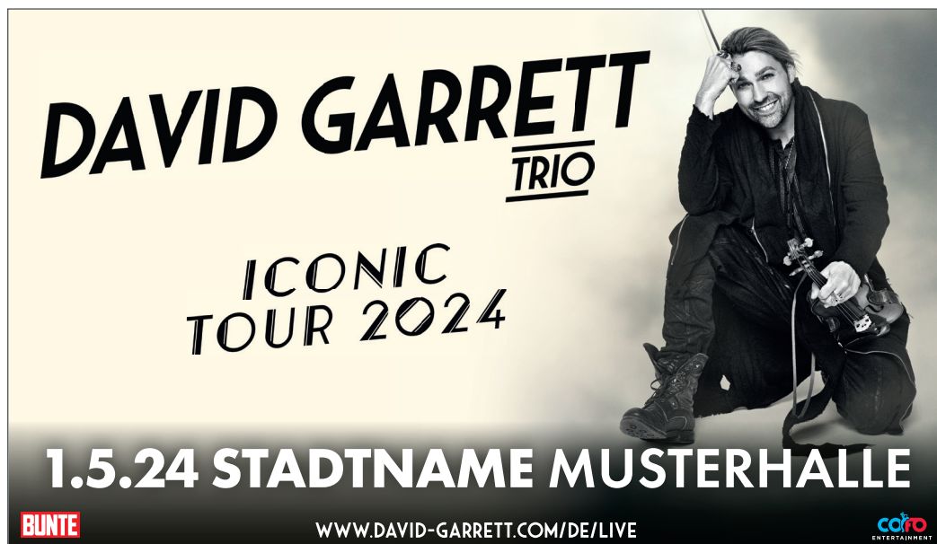
3-spaltig, 138 mm x 80 mm