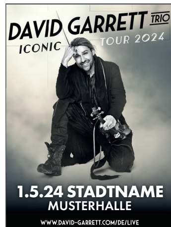
1-spaltig, 45 mm x 60 mm