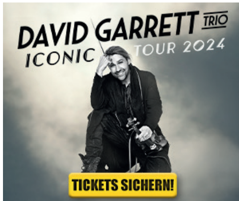
300 x 250 px