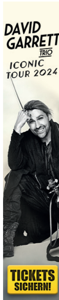
120 x 600 px