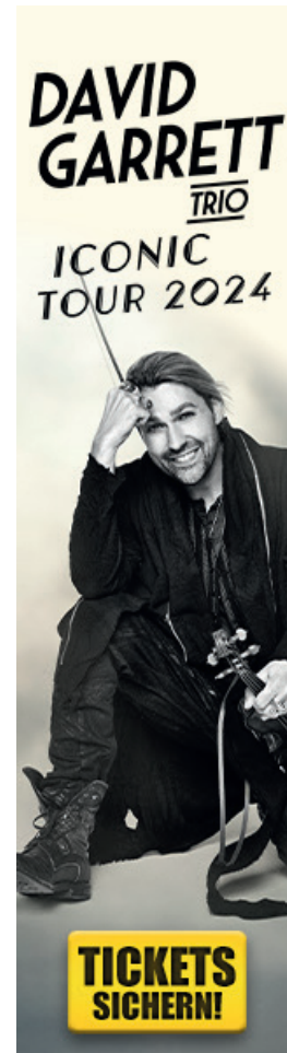
160 x 600 px